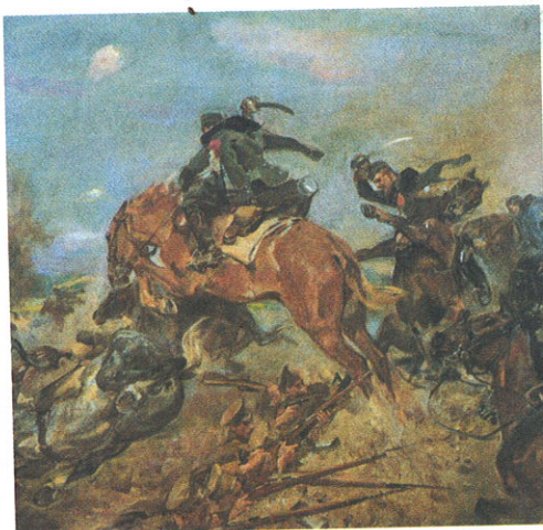
Wojciech Kossak, Szarża pod Rokitną (fragment)

2. Na podstawie tekstu Aktu 5 listopada wskaż poprawną odpowiedź na każde pytanie.